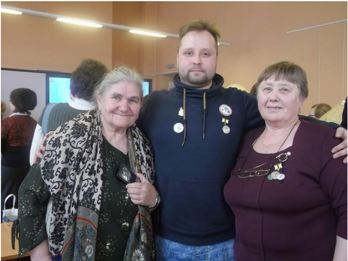
03.03.2019 очередное заседание РИРО прошло на базе библиотеки "Быстринская". Здесь организована музейная комната, посвященная истории Режевского химического завода.