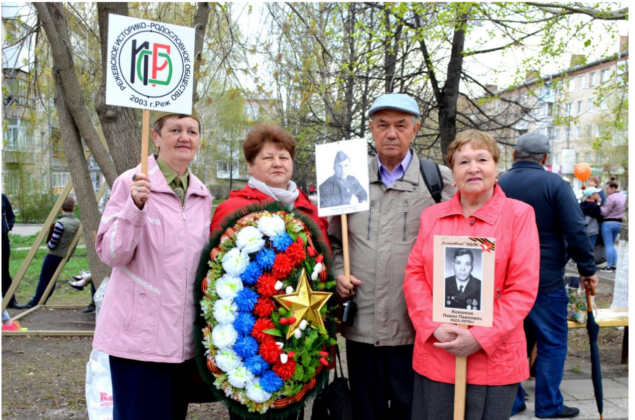
Режевские библиотекари по традиции собрали "Бессмертный книжный полк". И в нем участвовали сборники РИРО о войне "Шагнувшие в бессмертие" и "Плит гранитных строки".