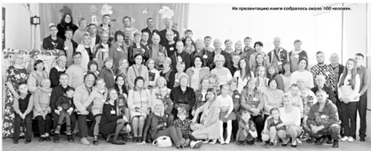
На презентацию книги собралось около 100 человек.