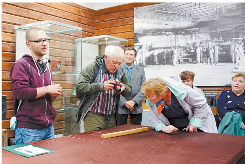
В музее краеведы с интересом осматривают один из экспонатов - древний календарь на деревянном бруске.

В итоге обсуждения краеведы решили составить список домов, которые надо со-