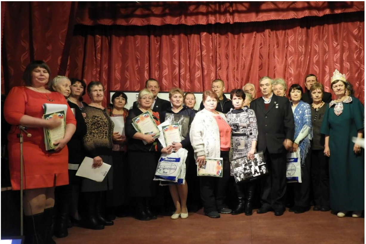
03.02.2019 состоялось очередное заседание РИРО. Центральной районной библиотеке подарен новый выпуск альманаха «Родовед Режа» №4 часть 4.