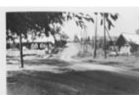
Село Арамашка – Родина рода ДОБРЫНИНЫХ